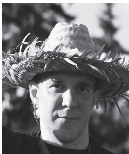
Gestatten: ALI'I – Häuptling auf Bawaii

LA ALOHA: Nach zwei Tagen Bawaii – wie geht's?