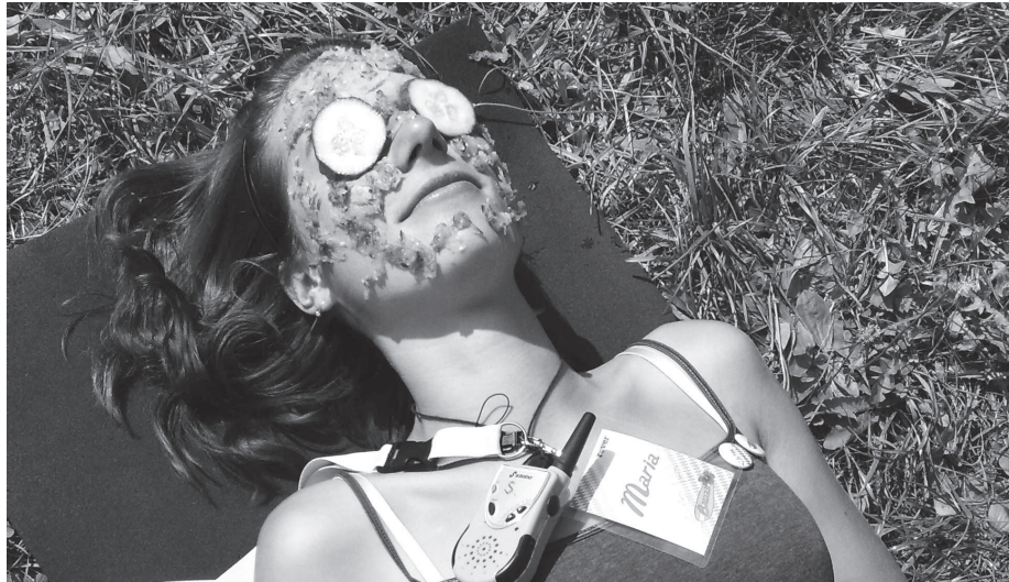
„Ist es noch weit? Kann man es schon sehen?“

Schnur befestigt werden. Unklar ist noch, wer seine neue Bawaii-Kluft in die Kirche anziehen wird.