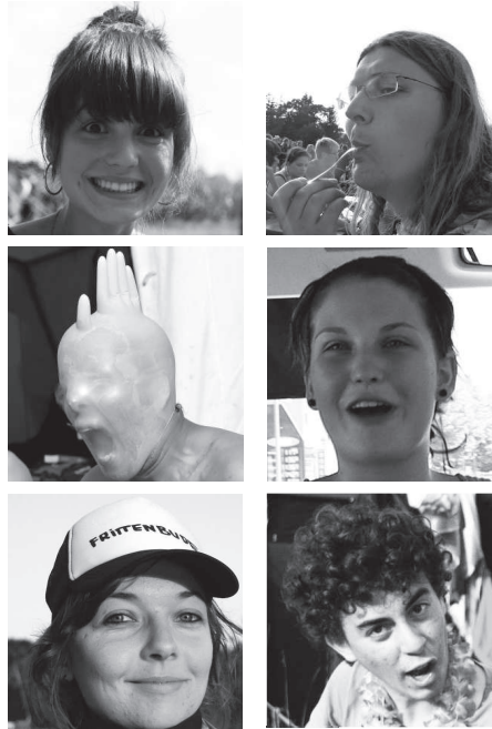
585 Teilnehmern gefällt das