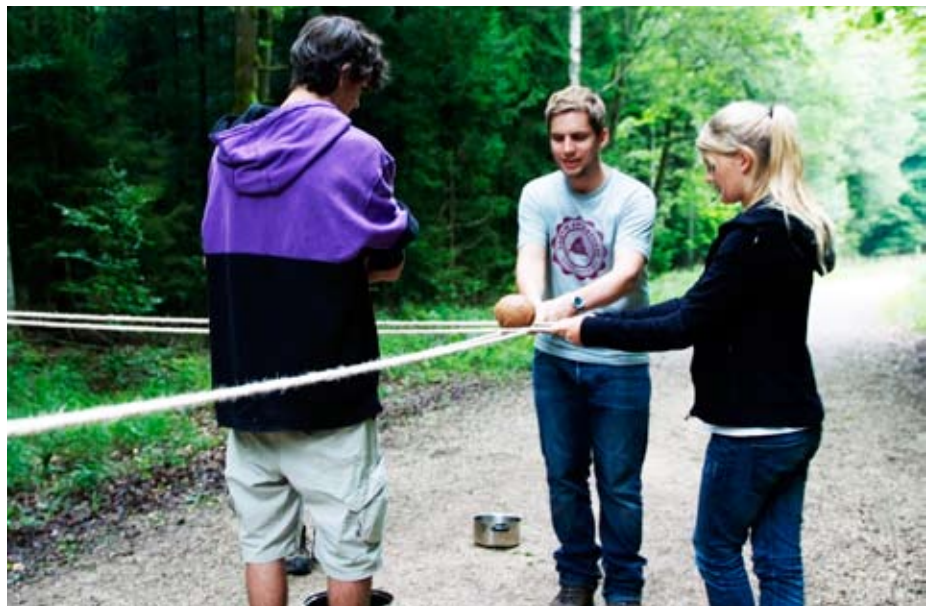
Schnurstracks ins Ziel: die Kokosnuss

Auch der kreative Teil der Bawaiianer kam beim Wettkampf nicht zu kurz. Beim HULAHUP, dem ältesten Tanz auf Bawaii, ließen sie fleißig ihre Hüften kreisen. Die Topleistung schaffte eine „Dancing Queen“ aus der Gruppe 35 (München Ost II) mit einer Minute und 12 Sekunden.